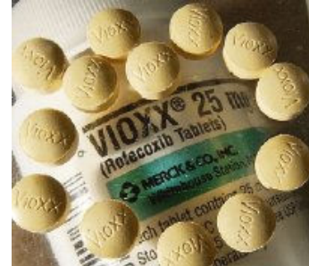
Vioxx fue retirado del mercado hace 3 años

El conglomerado farmacéutico Merck & Co. pagará 4 mil 850 millones de dólares para zanjar miles de demandas en uno de los mayores litigios civiles de Estados Unidos, anunció recientemente la empresa. Merck encaraba unas 26 mil 600 demandas judiciales de 47 mil demandantes, más 265 demandas colectivas potenciales, incoadas por personas o familiares según los cuales la droga Vioxx tuvo efectos fatales o lesionó a sus consumidores. El acuerdo cubre casos judiciales a nivel federal y estatal. El acuerdo será vinculante solamente si el 85% de los demandantes acuerda retirar sus demandas. El acuerdo fue finalizado la madrugada del viernes cuando los abogados de Merck y los demandantes se reunieron con tres de los cuatro jueces que atienden casi todos los reclamos relacionados con el Vioxx. Con ello, Merck supera la incertidumbre planteada por miles de casos pendientes y millones de dólares en costas procesales y posibles compensaciones, aunque hasta ahora se ha defendido con gran éxito en casos individuales.