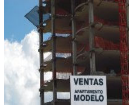
Controles. Bienes y raíces tendrá que reportar mov. de activos

Los últimos casos más relevantes de lavado de dinero han puesto en evidencia la vulnerabilidad del país en este tipo de ilícitos, por lo que las autoridades han decidido reforzar las leyes en esta materia. El director de la Unidad de Análisis (UAF), Amado Barahona, informó que ya están "bastante avanzadas" las actualizaciones que harán a la Ley 42 de 2000, relativa a la prevención del lavado de dinero y contra el financiamiento del terrorismo. Las reformas permitirán "una mayor movilidad entre los organismos de supervisión y control", que además tendrán un margen más amplio de actuación. Otro punto que se contempla es la obligatoriedad de las actividades de seguros y bienes raíces a reportar, además de las transacciones en efectivo, preparar informes de operaciones sospechosas. La comisión de alto nivel, que es la encargada de asesorar al Gobierno en las políticas para contrarrestar el lavado de activos y el financiamiento al terrorismo, es la que trabaja en el documento que se presentará próximamente al Órgano Ejecutivo. Este viernes tiene una reunión para seguir discutiendo el tema.